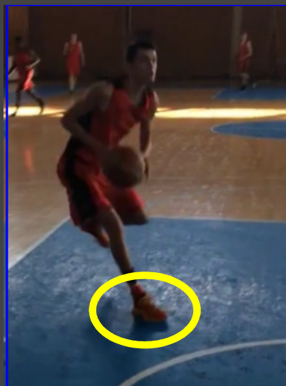
1 -step (pivotvoet)